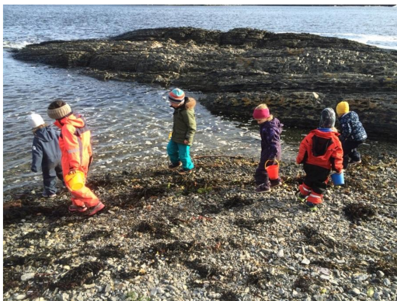
Grashoppa Barnehage 2017/2018

For barnehageåret 2017/2018 har vi ekstra fokus på fagområdene kommunikasjon språk og tekst og kropp bevegelse og helse.